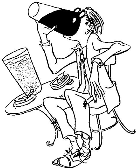
DET ER SNART OFSEKVELD - -