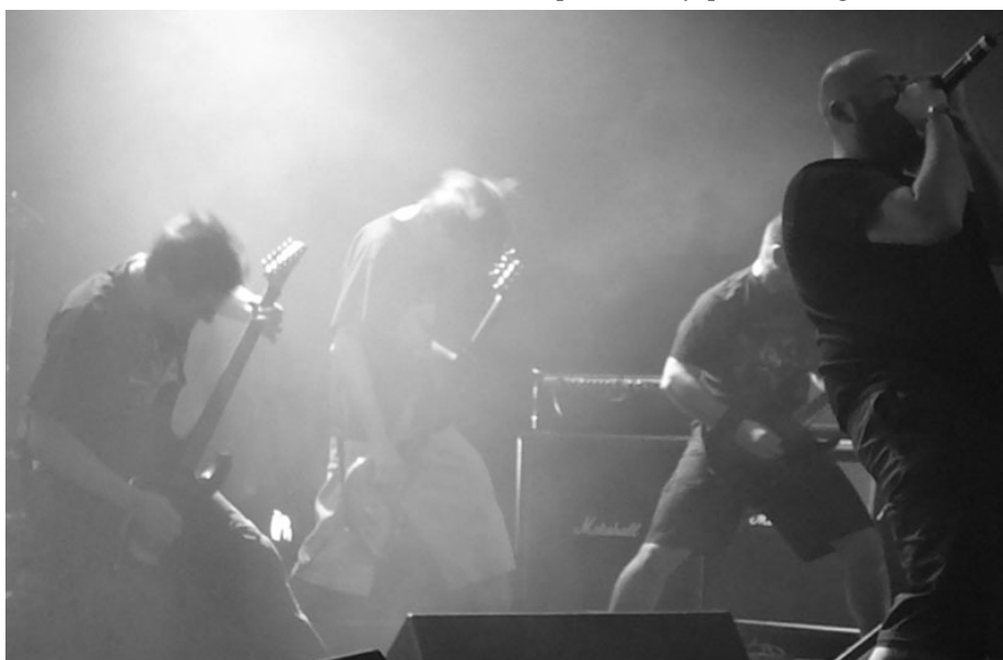
Agon stend på scena på Molodoi i Strasbourg.

Medlemene i Agon er frå Mulhouse og gruppa vart skipa i 2002. Som eg allereide hev nemnt so spelar dei einfeld og ende- fram daudmetall av same amerikanske merke som Cannibal Corpse og Napalm Death, og i år sleppte dei endeleg debutskiva "Violence Procreation". Du kann vitja gruppa på Myspace-sida http://www.myspace.com/agondeath .