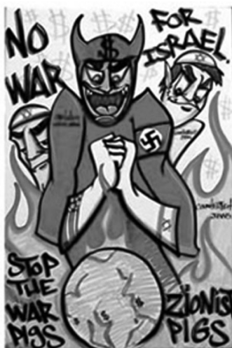
Moderne antisemittisme frå 2008.

I vedlegg 18 vert den jødiske omskjeringi av gutebarn sett i kontrast til den kristne dåpen. Nedst til vinstre ser me eit lite barn som er i ferd med å verta umskore. I flokken som stend rundt denne hendingi ser me noko som kann minna um ein devel-skapnad. Denne skapnaden lener den eine handi på hovudet til den som utfører omskjeringi. Develen ser ut til å ha klauvar i staden for føter og er utstyrt med horn. Etter folketrui er dette nokre av Satans kjenneteikn.