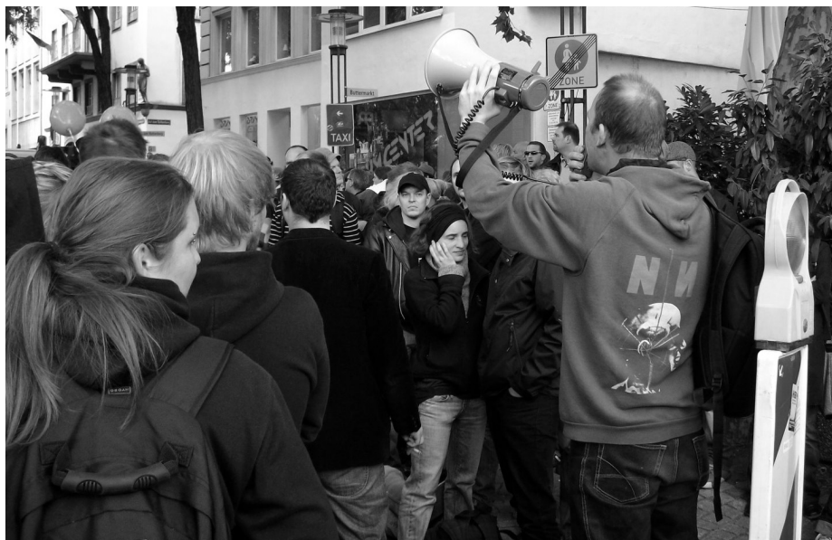
Ein leidande motdemonstrant dirigerar troppane sine med ropet: Styrk blokaden!

Klokka tolv skal dei åtti frammøtte ha starta med det annonserte programmet inne på Heumarkt, men det gjekk ikkje meir enn ti minutt fyre dei fekk høyra av Politiet at demonstrasjonen deira var vorten forboden. Den same meldingi vart gjeven yver megafon til motdemonstrantane på utsida – som naturlegt nok svara med stor jubel. Det byrja no å gå upp for meg kvifor Politiet ikkje vilde sleppa korkje demonstrantar eller motdemonstrantar inn på plassen, dei hadde trulegt planlagt å forby demonstrasjonen heile tidi, og då eg spurde ein av politimennene um kvifor demonstrasjonen var vorten forboden, so kunde han ikkje svara på det.