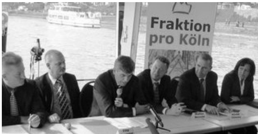
Pressekonferanse på Rhinen.

At det kom til å verta eit valdelegt utfall um demonstrantar og motdemonstrantar kom i kontakt med einannan – vart klårt nok allereide fredagskvelden, då det var tid for den fyrste pressekonferansen. Stutt tid fyre konferansen skulde haldast, fekk journalistane