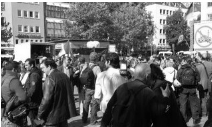
Ikkje so reint fæe hadde greidd å taka seg inn på Heumarkt fyre møtestaden vart blokkert av valdelege vinstreestremistar.