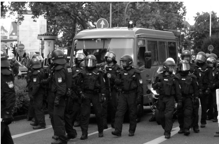
Mannsterkt politiuppbod, men kva hjelper det når dei berre stend og ser på at vanlege demokratiske borgarar vert trakasserte av vinstreaktivistisk ramp?

Dei 80 frammøtte Pro Köln-aktivistane vilde ikkje utan vidare godtaka at møtet som dei hadde planlagt mange månader fyreåt skulde verta forbode på staden. Dei vona i det lengste at dei tilreisande venene deira skulde klara å koma seg ned til Neumarkt, og det gjekk difor nokre timar med tingingar med Politiet fyre dei endeleg gav upp. Då eit titals av desse vart evakuerte frå marknadsplassen og yver i eit hus som stod i utkanten av det avsperra territoriet,