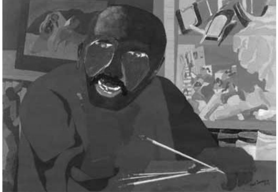
Jacob Lawrence. Sjølvpportrett frå 1977.