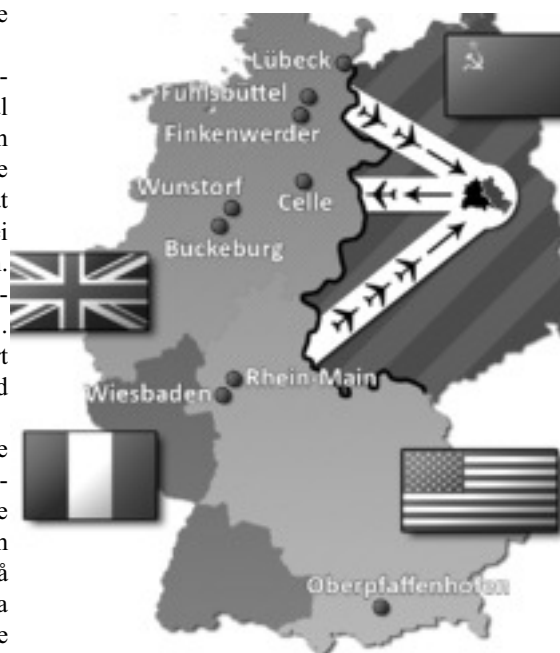
Luftkorridorane inn til Berlin.

277.728 flyturar vart det til slutt, fyre russarane gav opp og avslutta blokaden. Rekningi for luftbrui kom på 200 millionar dollar, som for det meste vart finansierte av amerikanske og britiske skattebetalarar. Men med luftbrui og kampen mot blokaden vart det klårt for det tyske folket at amerikanarane og britane stod på deira sida no, og at soldatane deira ikkje lenger var i landet for å okkupera dei, men for å verna dei mot den kommunistiske fåren frå aust. Og utan Berlin-blokaden, og seinare Berlin-muren, hadde det nok helder ikkje vorte nokor Berlin-tala (i 1963 av JFK og i 1987 av Ronald Reagan) som Barak Obama meir enn 40 år etter JFK kunde slå politisk mynt på i presidentvalkampen. Men denne gongen var det altso ingen mur.