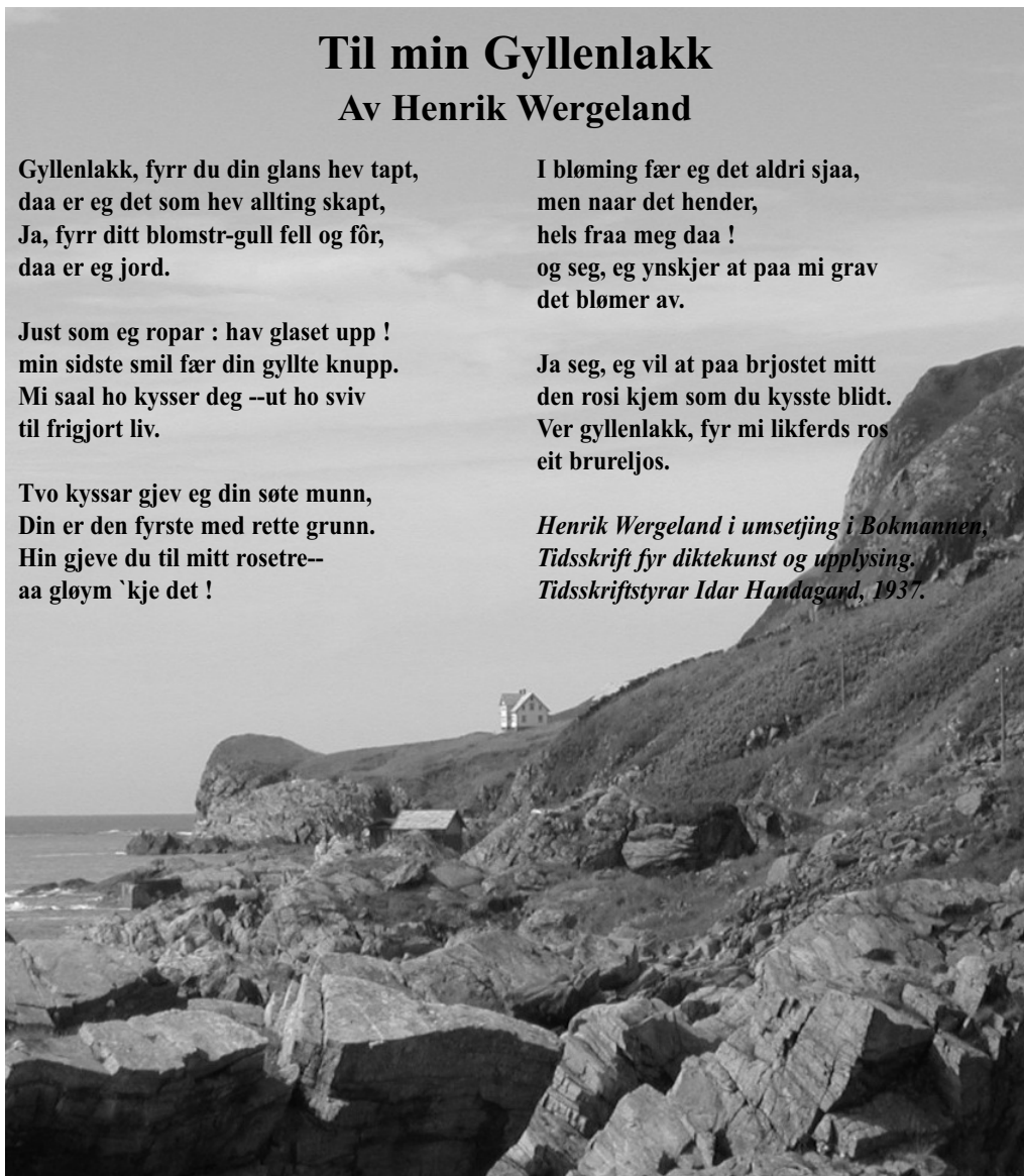
Motiv frå Ytre Fure på Stadlandet.