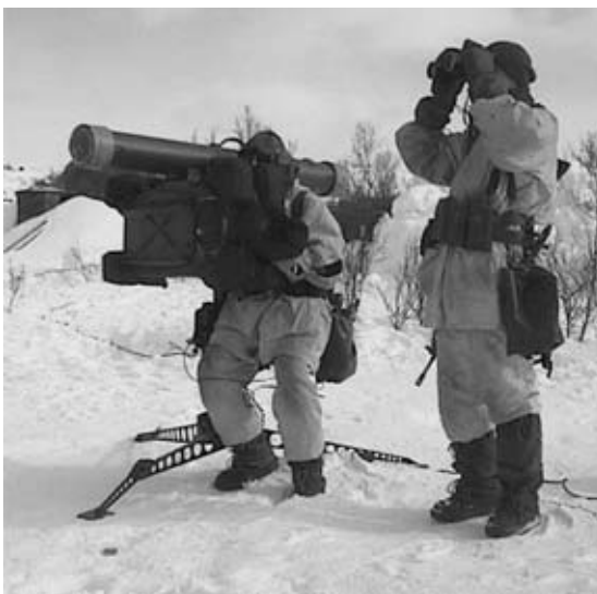
Illustrasjon 1: Det laserstyrte rakettvåpenet Robot-70 vart nytta i lett luftvern fram til 2004.

Ein gong i tidi var det noko som heitte Soldatmållaget, men det er lenge sidan det. Målungdomar som hev vorte kalla inn til fyrstegongstenest hev sumtid tala um å skipa dette laget upp att, som eit reint papirlag, men det hev ikkje vorte med det ein gong. Og med den umskiping i Forsvaret hev vore gjennom dei seinste åri, der invasjon-forsvaret hev vorte nedlagt og bytt ut med innsatsstyrkar til internasjonale operasjonar, er det lite sannsynleg at fleire nynorskforkjemparar let seg rekruttera med det fyrste. Organiserte målfolk flest segjer som kjent nei til USAs krig mot terrorismen og andre "imperialis-