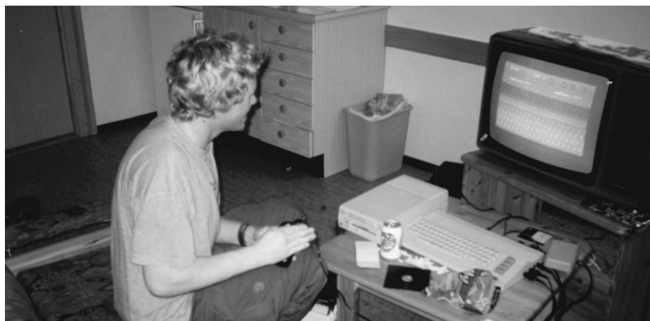
Commodore 64 - i si tid den mest populære heimedatamaskinen.

Mikromaskinane var ikkje berre til heimebruk, dei kunde nyttast i industri og eksperimentell verksemd med. Maskinar som skulde kommunisera med måleinstrument laut vera compatible med IEEE 488-standarden, betre kjend som HPIB eller GPIB. IEEE 488 er ein standard industribuss som vart og vert nytta av folk som byggjer instrument. Den sokalla instrumentbussen vart opphavleg utvikla av Hewlett-Packard, og var meint å ordna samband millom ein datamaskin og opp til 16 ulike instrument. Jamvel um IEEE-488-bussen fyrst og fremst var ein instrumentbuss, vart han i sume maskinar nytta som systembuss med, til dømes i Commodore PET. Medan S-100-standarden for lengst er daud og