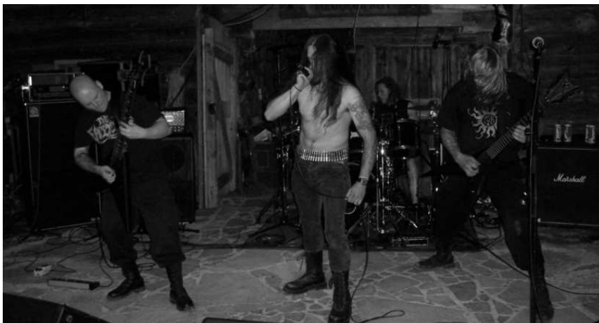
Krass daudmetall på høgt teknisk nivå med Amongst The Deceit.

Ljodbilætet var meir tung og myrkt enn med Celtic Frost, og bassklangen hennar Vanja