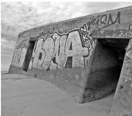
Ein gamal bunker som ikkje fær stå i fred for taggarar.