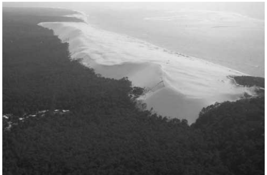
La Dune du Pylat, sedd frå lufti.