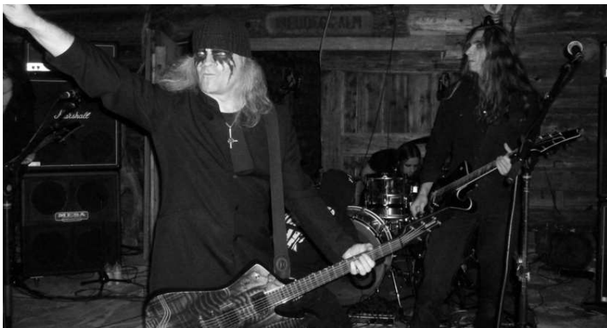
Thrash-klassikarar med Triptykon og Tom Warrior.