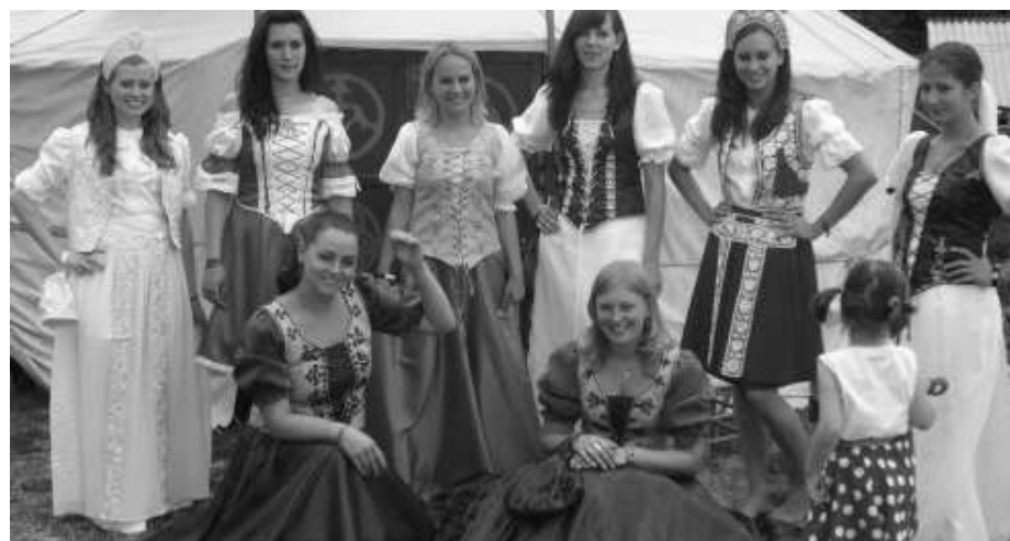
Ungarske gjentor syner fram hevdvunne klesdrakter.

vandslegt tema å taka stoda til, men tilhøyrarane fekk i alle høve lyda til sers forvitnelege augevitneskildringar, millom anna frå kampane i Vukovar og Dubrovik.