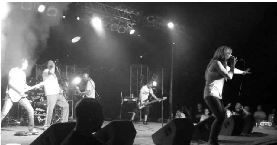
Svenske Saga avslutta Festival Boreal.