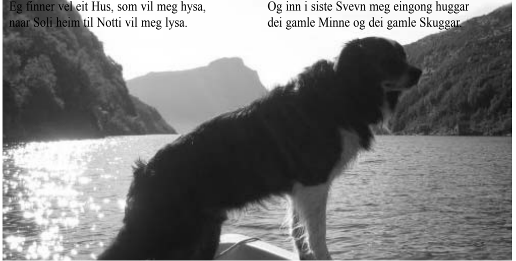
Borknepollen med det sogeumspunne fjellet Hornelen attum.

Og kvar ein Stein eg som ein Kjenning finner, for slik var den, eg flaug ikring som Gut. Som det var Kjempur, spyr eg, kven som vinner av den og denne andre haage Nut. Alt minner meg; det minner, og det minner, til Soli burt i Snjoen sloknar ut. Og inn i siste Svevn meg eingong huggar dei gamle Minne og dei gamle Skuggar.