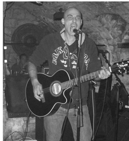
Frakass avslutta dagen med fengjande låtar som lokka til allsong.