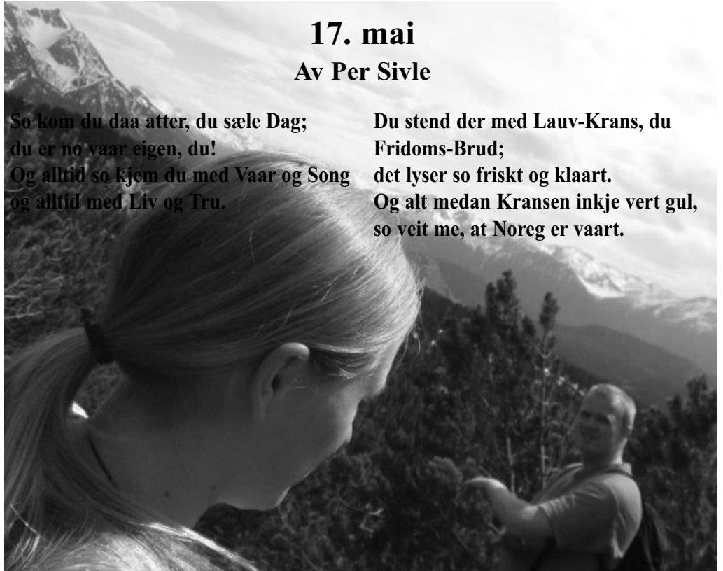
Vårmotiv frå Leutasch i Tirol, Austerrike.

Og alt medan Kransen inkje vert gul, so veit me, at Noreg er vaart.