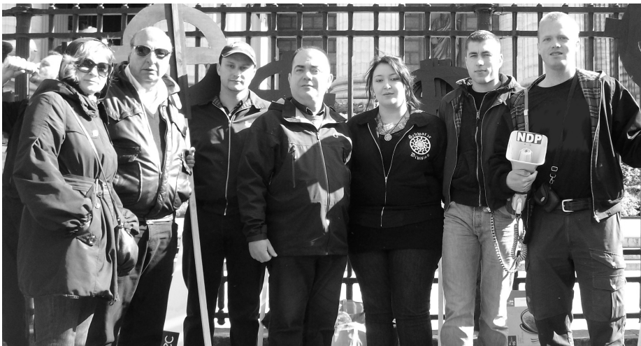
Inter-europeisk: Målsmennar frå Ukraina (Swoboda), Spania (La Falange), Hellas (Chryssi Avyi), Frankrike (Nouvelle Droite Populaire) og Noreg (Målmannen).

Etter at manifestasjonen var slutt, vart det bode inn til konsert med gruppone Frakass, Lemovice og Franc-Tireurs-Patriotes, som er noko av det beste som den patriotiske rocken kann bjoda på. Stemningi var minst like god som under manifestasjonen: Frakass var som vanlegt på hogget med sina velreflekterte tekstar og drivande melodiar, og allsong-faktoren nådde nye høgder når Franc-Tireur-Patriotes spela gamla patriotiske rock-klassikarar som Insurrection sin "Combattant d'Occident" og In Memoriam sin "Assasins de mon peuple".