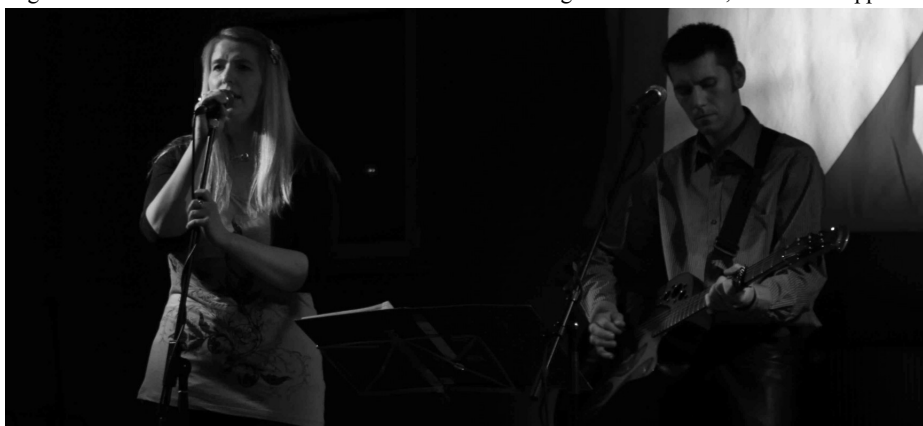
Projekt Aaskereia avslutta programmet for dagen.

Kvelden vart avslutta med konsert av musikkgruppa Projekt Aaskereia, og med open folkedans der kvar og ein av dei framømte hadde høve til å få svinga seg etter ein lang dag med tett program.