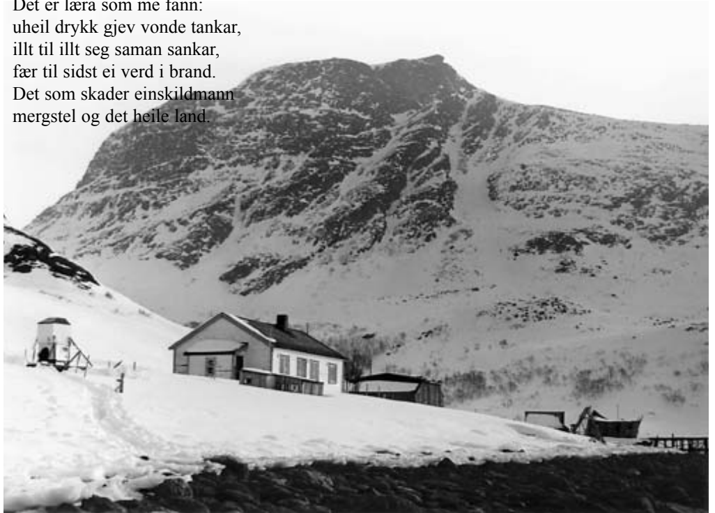
Børfjord på Sørøya, vinteren 1988.

Det er læra som me fann: uheil drykk gjev vonde tankar, illt til illt seg saman sankar, fær til sidst ei verd i brand. Det som skader einskildmann mergstel og det heile land.