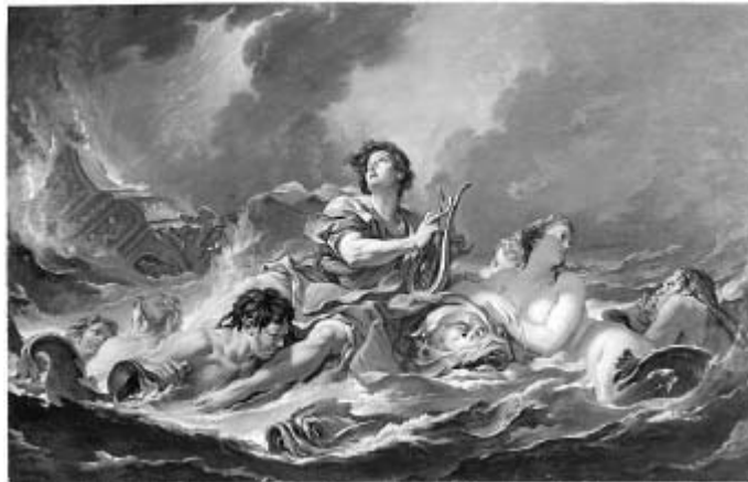
«Arion på delfinen» av François Boucher (1703–70)

på havet, til kongen, som ikkje visste noko um hendingi i det heile. Men kongen kunde ikkje heilt tru Arion og sette han under vakthald, som um han skulde fara med lygn og svik. No lét Periander strakst kalla til seg skipsmannskapet, og spurde utan at ein kunde merka noko på