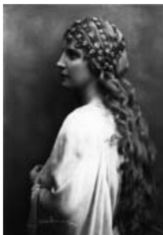
Kirsten Flagstad som Elsa i Lohengrin, Nationaltheatret juni 1929

stadii som fører til den mystiske sameiningi med Kristus. Men til liks med Kirsten Flagstad fekk Teresa òg vanskar med autoritetane. Ho var ikkje rædd for å kritisera ei rad mishøve innanfor kyrkja, noko som førde til at boki kom i søkjeljoset for inkvisisjonen, og fyrst seks år etter at ho døydde, vart boki stempla som « imprimatur », det tyder at ho « kann prentast ».